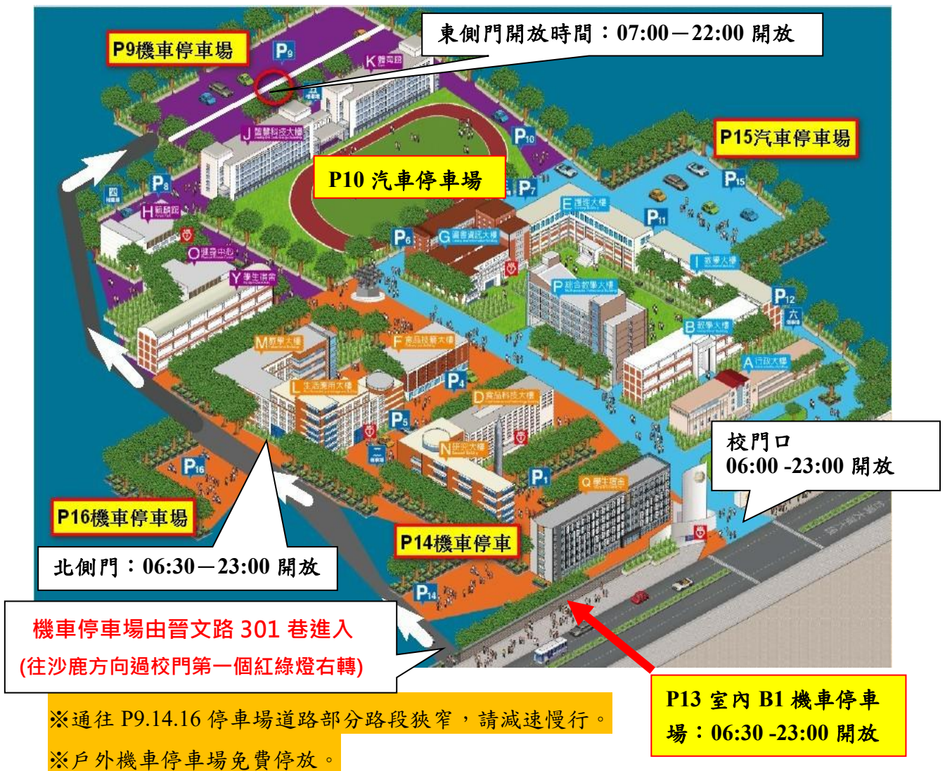
圖 1：校外及室內汽機車停放位置圖