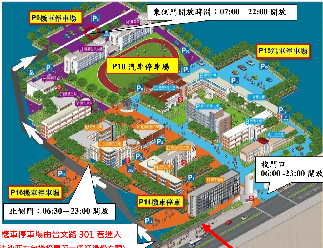
圖 1：校外及室內汽機車停放位置圖