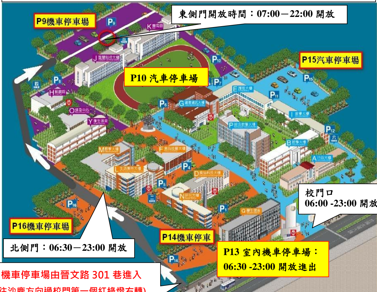
圖 1：校外及室內汽機車停放位置圖