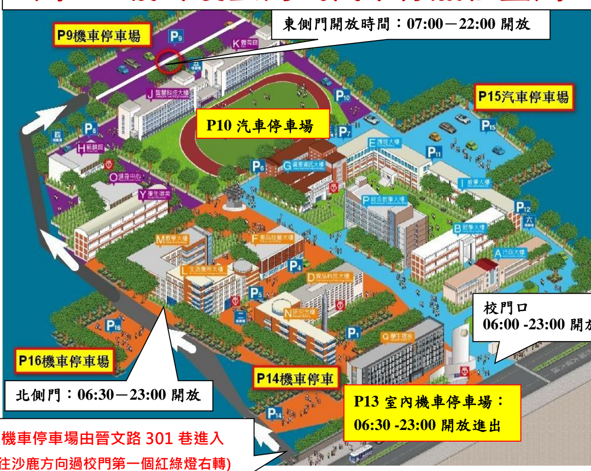
圖 1：校外及室內汽機車停放位置圖

五、因應新冠病毒疫情，進出校門管制措施將視疫情進行滾動式修正，請詳學校網站首頁最新消息。